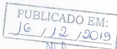
Carlos Alberto Morais Prefeito Municipal

Artigo 3º - Esta lei entrará em vigor na data de sua publicação, revogadas as disposições em contrário.