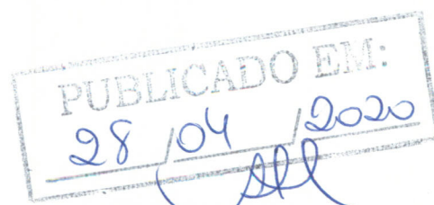
CARLOS ALBERTO MORAIS PREFEITO MUNICIPAL

Gabinete do Prefeito, Brazópolis, 28 de Abril de 2020.